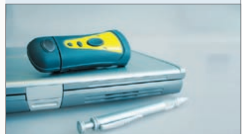
↳ Midi-Barcode-Scanner P-1