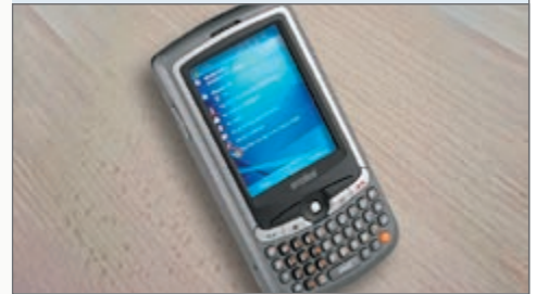
↳ Management PDA MC35

Jedes Modul kann separat aktiviert und konfiguriert werden.