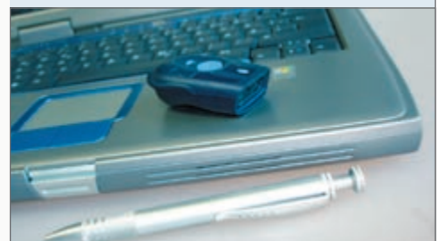
↳ Mini-Barcode-Scanner S-1