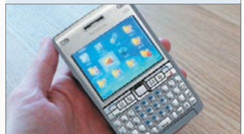
↳ Smartphone E61i