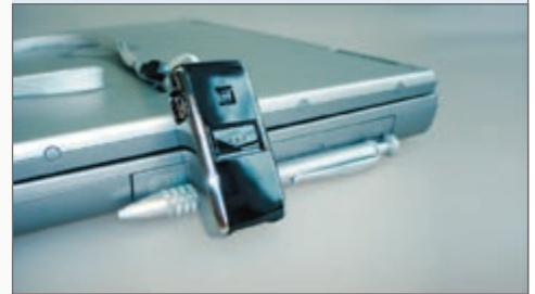
↳ Mini-Barcode-Scanner O-1

Dieses strukturierte Vorgehen hat sich vielfach bewährt. Neben großen Unternehmen arbeiten auch viele kleine und mittlere Betriebe mit unseren Produkten.