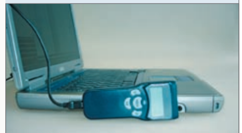
↳ Midi-Barcode-Scanner Z-2