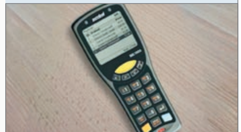
↳ Industrial MDE MC1000